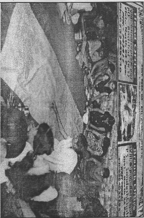
দুস্থ মেয়েদের স্থানভর কৰতে পাঁপড় তৈৰিৰ প্ৰশিক্ষণ চলছে।

সুভাষীষ, বঙ্গবাহাট : আধিকৃতভাৱে দুৰ্বল হলেও সংস্থাটি সুন্দৰবন এলাকাৰ দুস্থ নিজেদের শ্ৰম ও অভিজ্ঞতা দিয়ে এই মেয়েদের আধিকৃত ভাৱে এই প্ৰকল্প বাস্তৱায়নৰ দিকে হাটি হাটি স্থানভৰ কৰাৰ উদ্দেশ্যে পা পা কৰে এগিয়ে চলেছে। এই সংস্থাটি বিভিন্নভাৱে হাতে কলমে প্ৰশিক্ষণ বৰ্তমানে আয়কৰ পণ্ডাৰ খোকে ৮০জি দেওয়াৰ কাজটি যত্ন সহকাৰে কৰে এবং ১২ এএ সাটি ফিকেট লাভ যাচ্ছে সদ্যেপাঞ্জি মা সারদা ওয়ান কৰেছে। যাৰ ফলে আধিকৃত প্ৰতিষ্ঠান বা এও কৰাল ওলেলেফাৰ সোসাইটি সংস্থা যদি এই সোসাইটি পক্ষে অৰ্থ